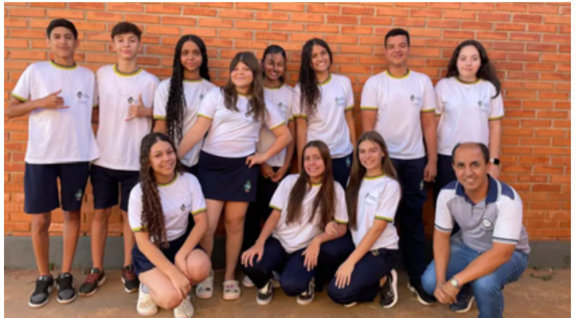
Alunos do Capi Professora Izabel Christina de Souza Ortiz e CEPMG Miriam Benchimol, campeões da etapa nacional da OIMSF, que reúne estudantes de 42 países