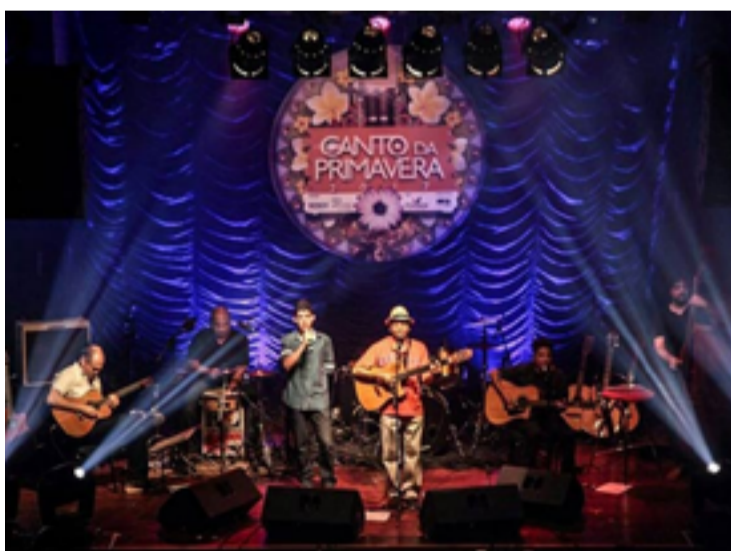
Com um investimento de R$ 3,3 milhões, o festival é considerado a maior vitrine da música goiana

Para saber o horário específico da apresentação de cada artista, a programação detalhada está site