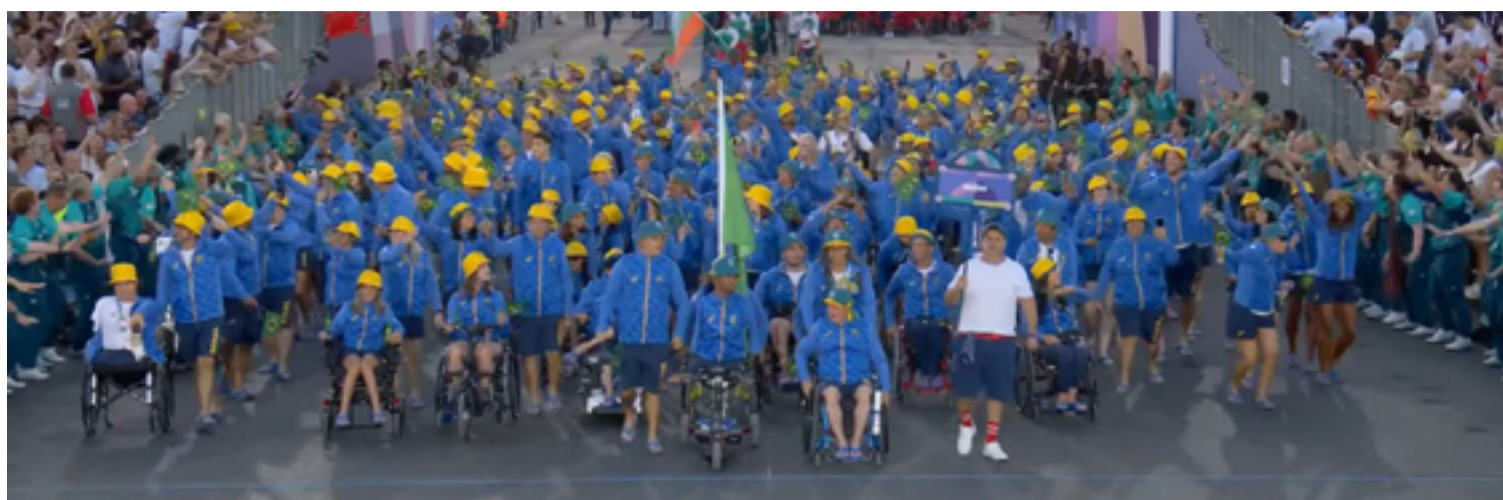
Cerimônia histórica foi realizada fora dos limites de um estádio e simboliza a ambição de Paris 2024 de colocar a inclusão de pessoas com deficiência

A cerimônia de abertura dos Jogos Paralímpicos de Paris 2024 transformou a icônica avenida Champs-Élysées e a Praça La Concorde em um palco espetacular para celebrar a diversidade e o espírito paralímpico. Cerca de 4.400 atletas de 185 delegações desfilaram