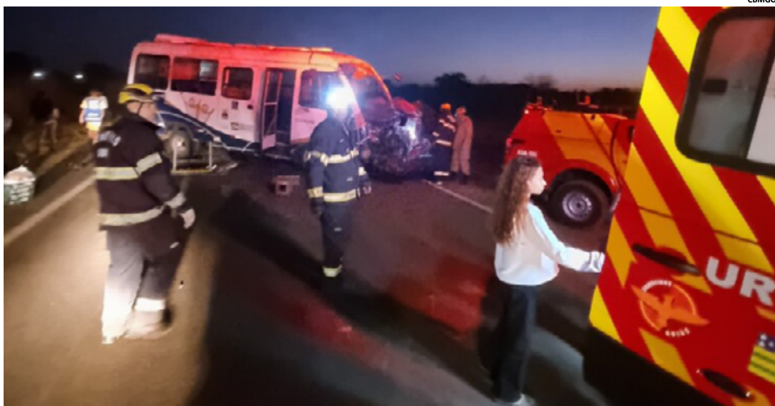
A colisão envolveu um micro-ônibus que transportava 26 pessoas e um Fiat Strada

O Corpo de Bombeiros de Planaltina foi acionado prontamente, juntamente com duas viaturas do Serviço de Atendimento Móvel de Urgência (SAMU) de Formosa, para prestar socorro às vítimas. As equipes de resgate chegaram rapi-