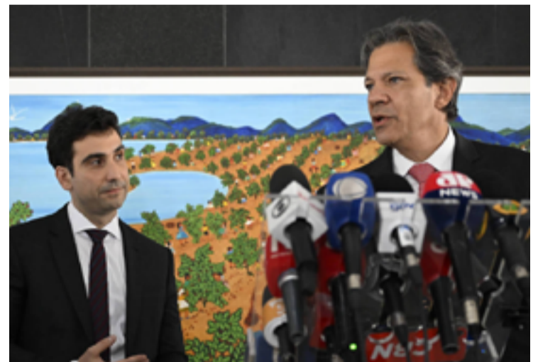
Fernando Haddad e Gabriel Galípolo: novos rumos para o Banco Central

“Na mesma magnitude, uma honra, um prazer e uma responsabilidade imensa ser indicado à presidência do Banco Central do Brasil pelo ministro Fernando Haddad e pelo presidente Luiz Inácio Lula da Silva”, afirmou Galípolo, sorridente.