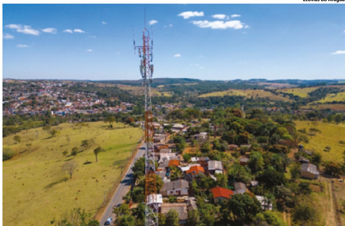
Sistema já beneficia pelo menos 27 municípios dos estados de Goiás e do Tocantins

Além de Anápolis, em Goiás, os municípios de Pirenópolis, São Francisco de Goiás, Jaraguá, Rianópolis, Rialma, Nova Glória, São Luiz do Norte, Hidrolina, Uruaçu, Campinorte, Mara Rosa, Estrela do Norte, Santa Tereza, Porangatu, Abadiânia, Corumbá de Goiás, Cocalzinho de Goiás, Vila Propício, Barro Alto e Santa Rita do Novo Destino