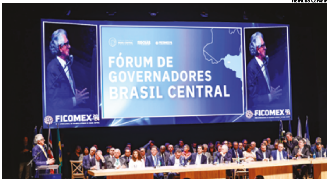
Ronaldo Caiado durante a feira que reuniu representantes de sete unidades da federação para discutir o desenvolvimento da região

O Fórum integra a Feira Internacional de Comércio Exterior do Brasil Central (Ficomex), que segue com programação até esta quinta-feira, 29. “Temos atuado de forma conjunta, para mostrar nosso potencial e o respeito que nós temos uns pelos outros”, reforçou Caiado sobre a cooperação dos estados. Caiado preside o Consórcio Interestadual de Desenvolvimento do Brasil Central (BrC), associação pública com foco no crescimento da região.