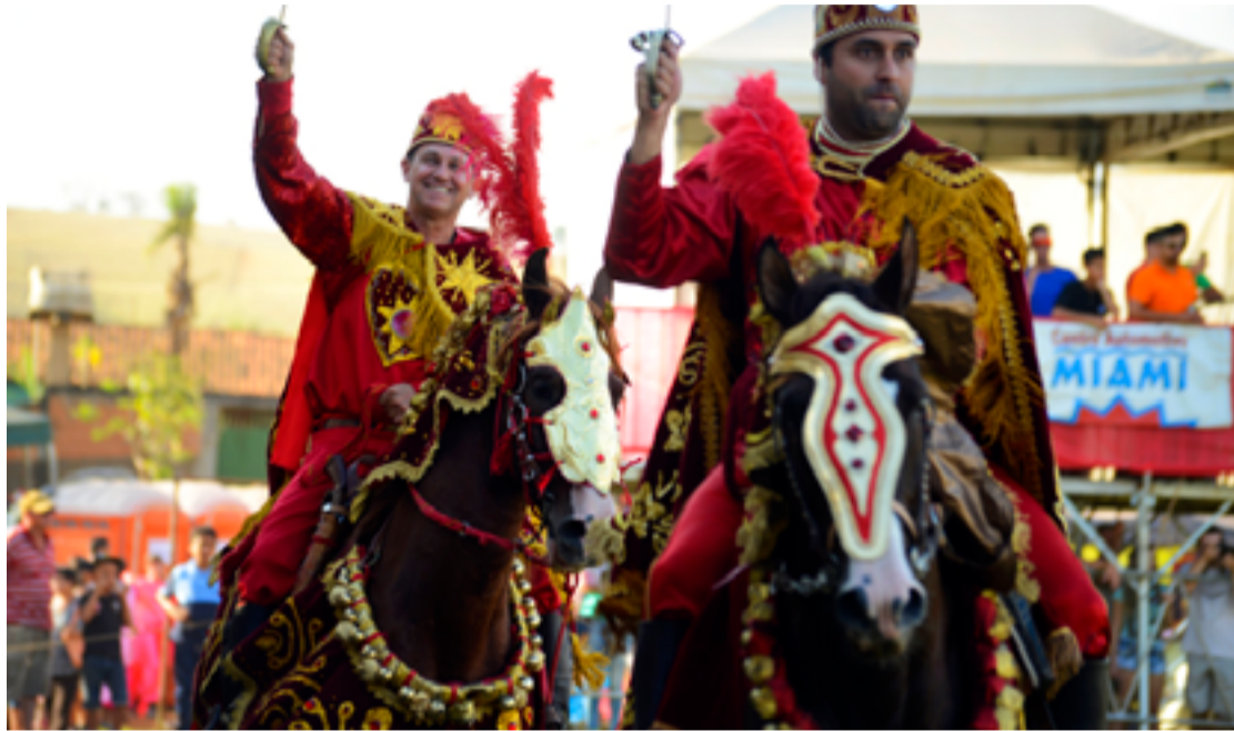
As Cavalcadas de Corumbá são marcadas por uma encenação histórica na qual 12 cavaleiros de cada lado, representando cristãos e mouros

As Cavalcadas de Corumbá são marcadas por uma encenação histórica na qual 12 cavaleiros de cada lado, representando cristãos e mouros, se enfrentam simbolicamente em uma batalha que culmina com a vitória dos cristãos. Os participantes vestem trajes tradicionais que distinguem os dois grupos: os mouros com vestimentas vermelhas e os cristãos com roupas azuis. Essa