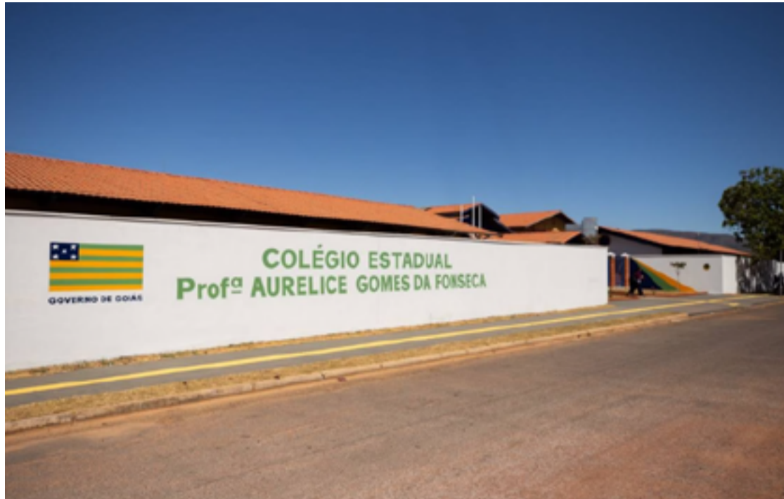
Atualmente, a escola conta com 106 alunos matriculados, e a gestora Isabel Tharyne, de 30 anos, acredita que o resultado positivo é fruto de um trabalho árduo e contínuo

Atualmente, a escola conta com 106 alunos matriculados, e a gestora Isabel Tharyne, de 30 anos, acredita que o resultado positivo é fruto de um trabalho árduo e contínuo, que ganhou ainda mais relevância durante