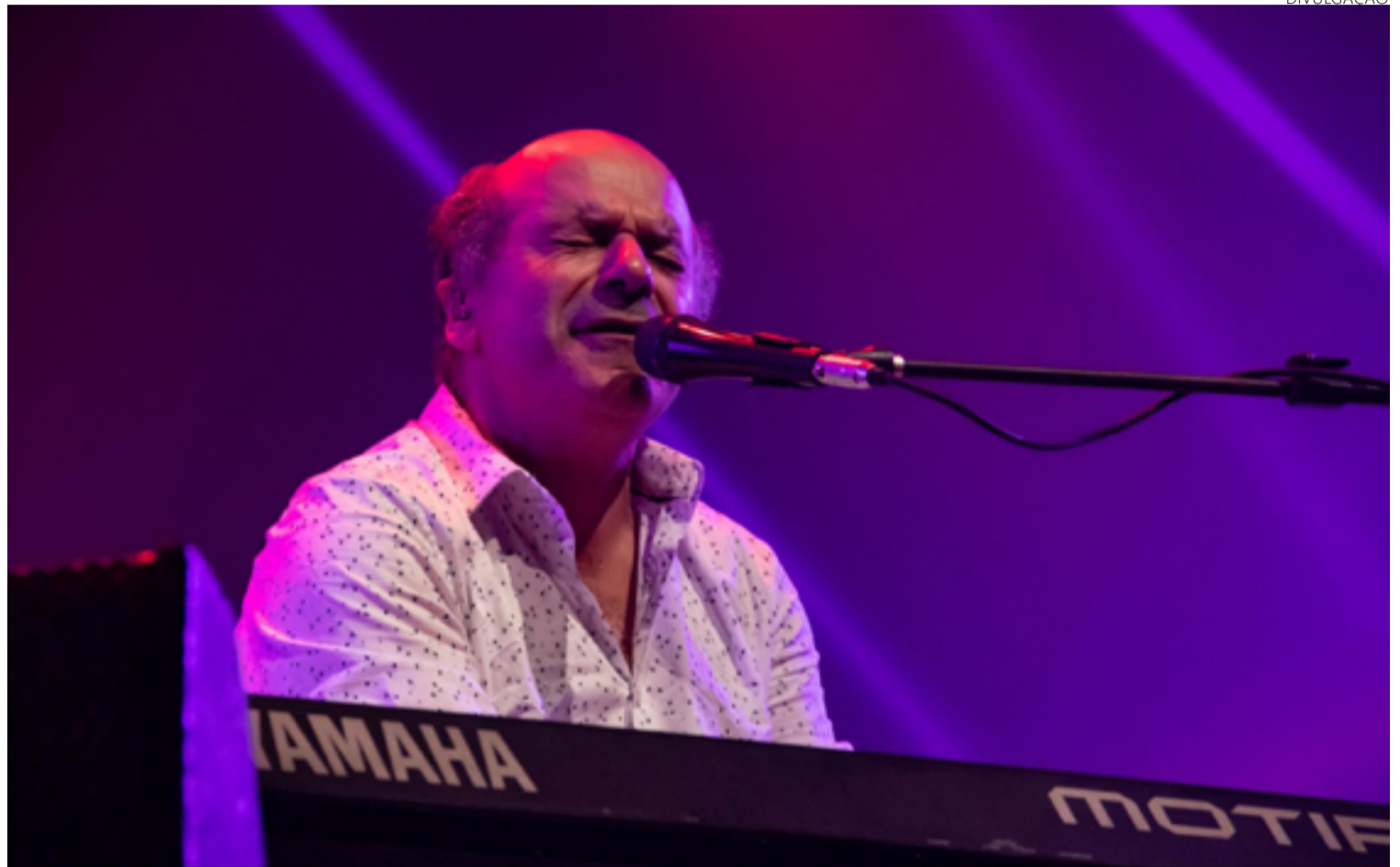
Supertramp representa a música dos anos 70: banda explodiu com disco lançado em 79

"É o disco que todos amam", declara Oheix, que aponta as canções desse disco como essenciais para a banda tributo. O grupo não repete em suas apresentações os setlists habituais das turnês do Supertramp. "A ordem das músicas é decidida por nós. Abrimos com alguma tranquilidade, inserimos um miolo com alguns hits e então partimos com os