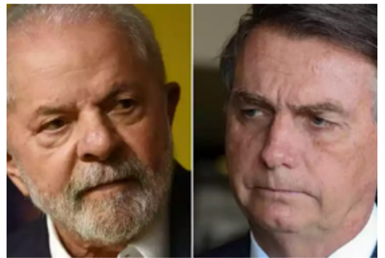
Lula da Silva e Bolsonaro: nomes nas urnas