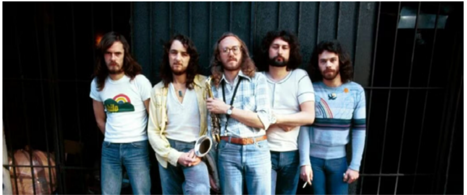
Supertramp representa a música dos anos 70: banda explodiu com disco lançado em 79

maiores sucessos para um final espetacular." Aí entram "The Logical Song", "Dreamer" e "Goodbye Stranger", entre outros hinos.