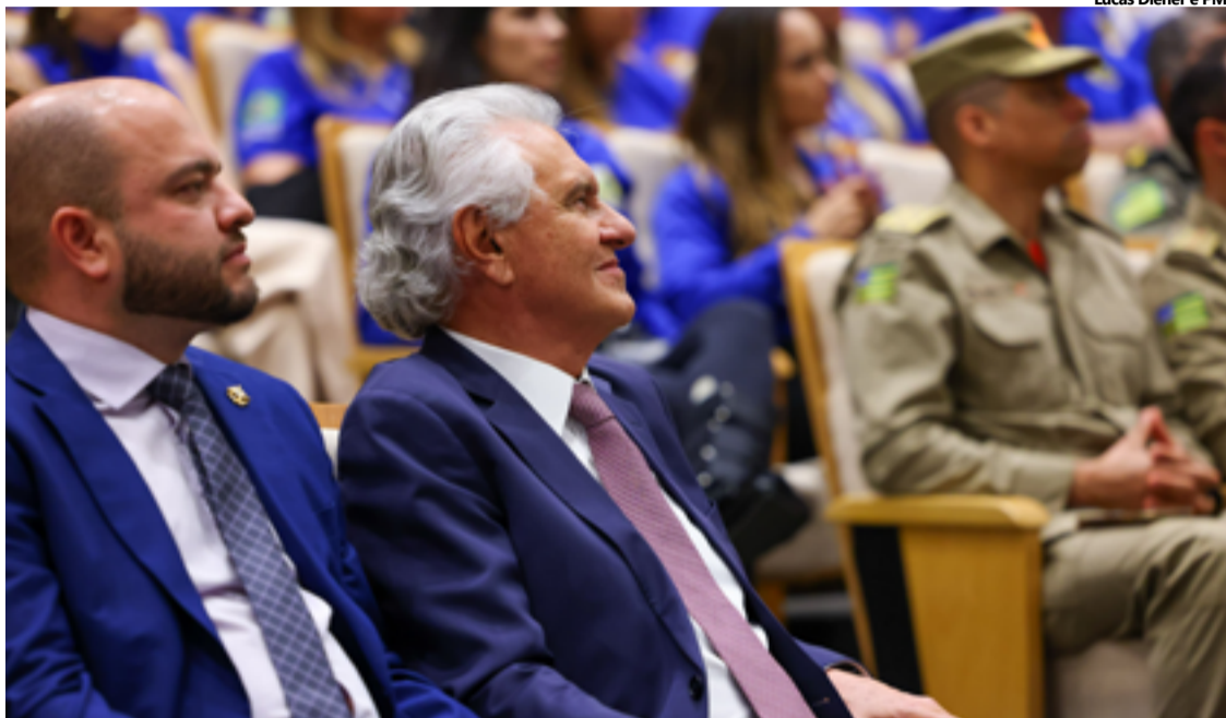
A declaração aconteceu durante palestra ministrada pelo Promotor de Justiça do Ministério Público de São Paulo (MP-SP), Lincoln Gakiya

Idealizada pela SSP-GO, a palestra foi realizada com o objetivo de apresentar às forças de segurança goianas, estratégias de sucesso no combate ao crime organizado. “O promotor Gakiya é reconhecido nacional e internacionalmente como aquele que se destacou no combate às facções criminosas e ao crime organizado do nosso país. E essa palestra