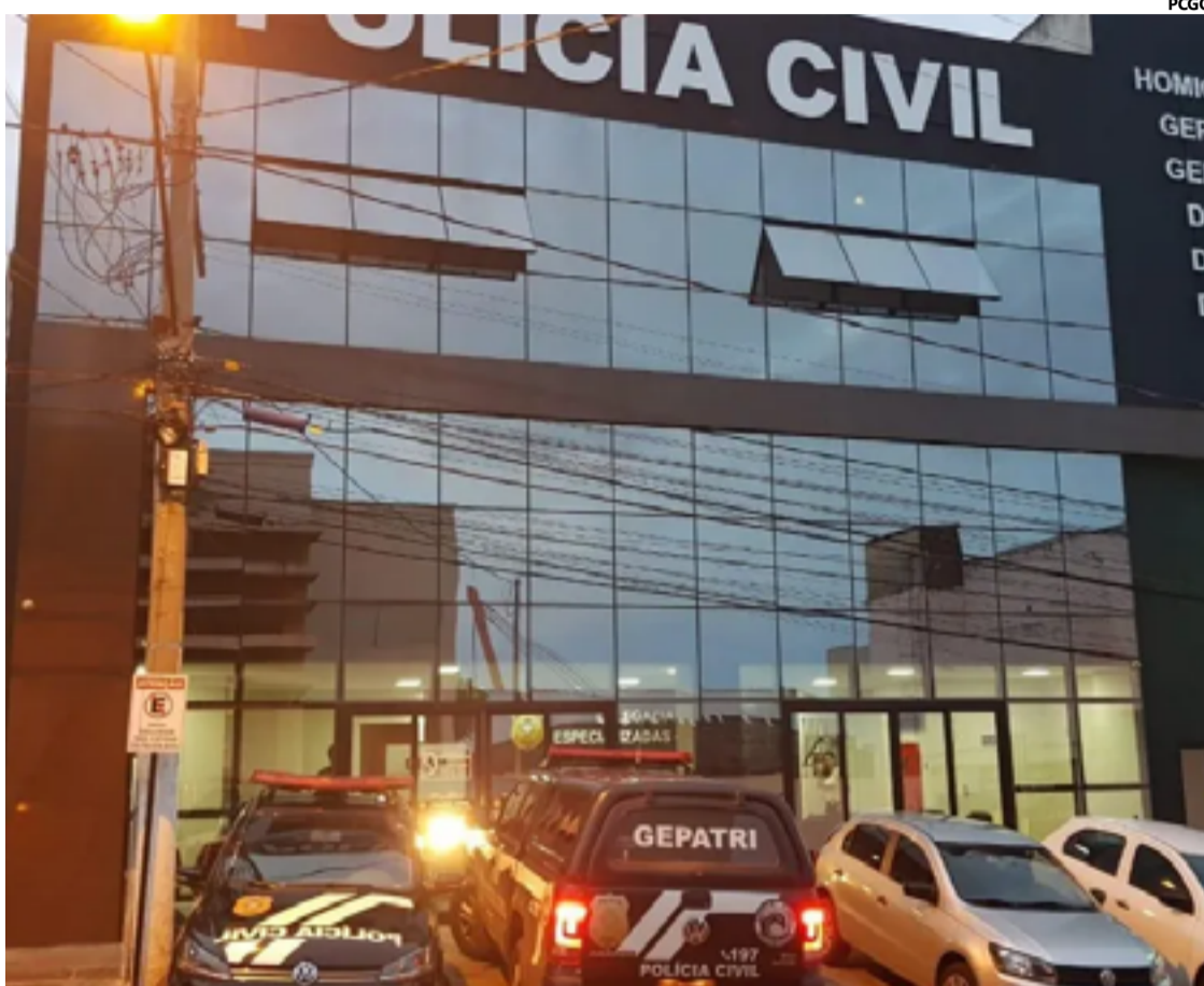
Diante da gravidade da situação e com a denúncia em mãos, os policiais da DEAM iniciaram diligências para localizar o suspeito

As medidas protetivas de urgência são um instrumento fundamental para garantir a segurança de vítimas de violência doméstica, especialmente em casos onde há histórico de agressões ou ameaças. O descumprimento dessas medidas é considerado um crime grave e pode resultar em prisão imediata, como foi o caso desta ocorrência em Luziânia.